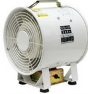
TYPHOON U-12, WIN MAMA